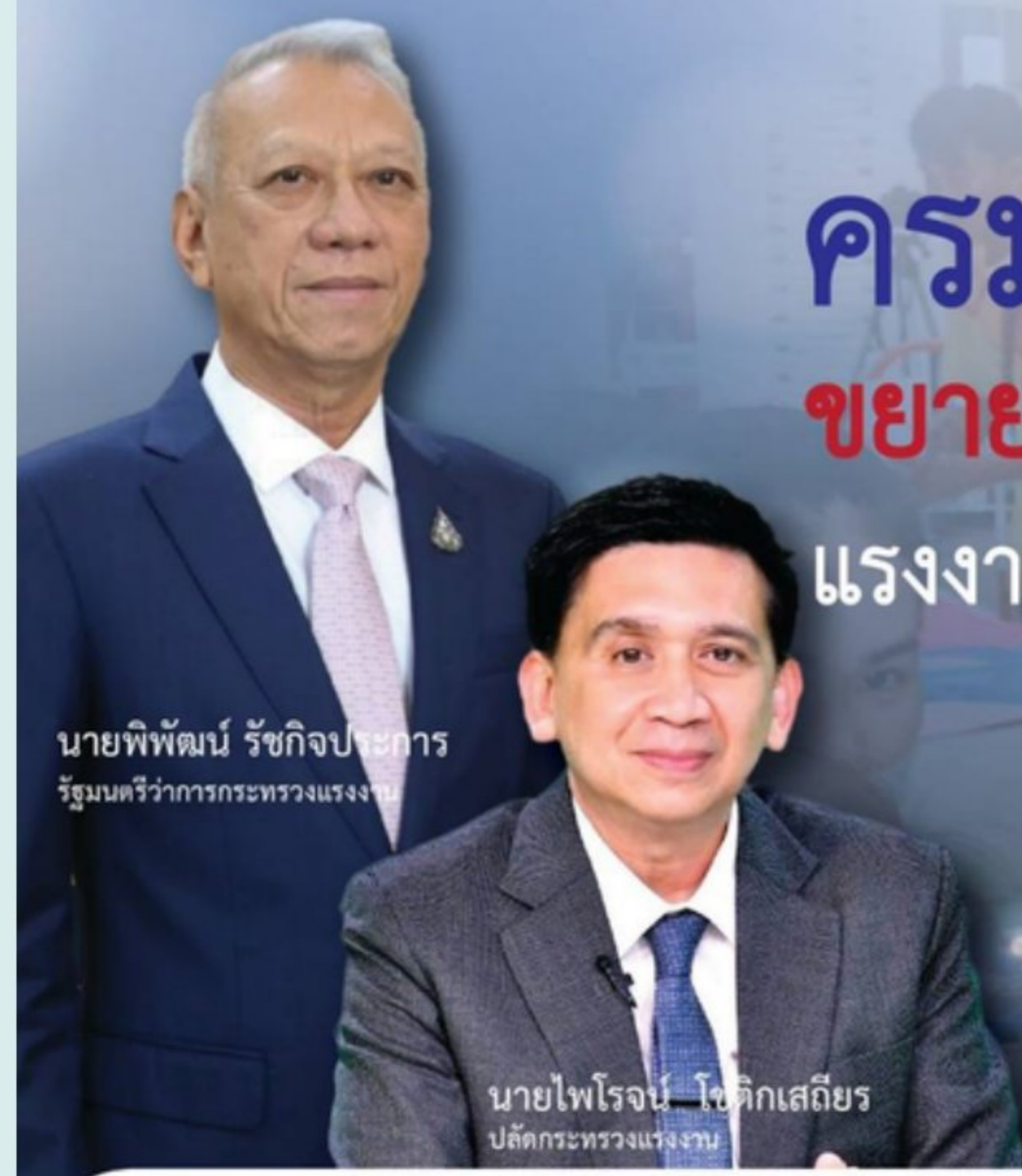
นายพิพัฒน์ รัชกิจประการ รัฐมนตรีว่าการกระทรวงแรงงาน